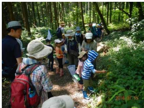
大草谷津田いきものの里