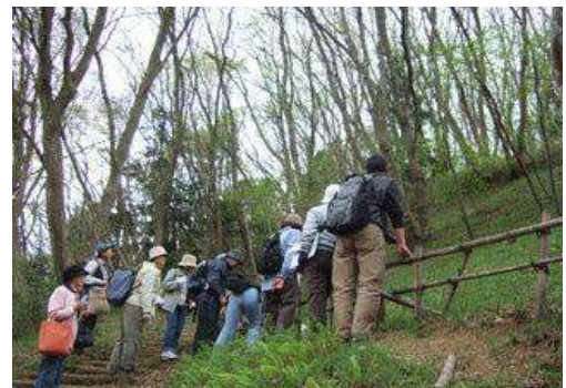
昭和の森カタクリ移植地