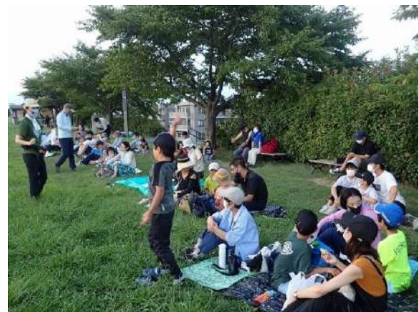
東葛しぜん観察会・江戸川