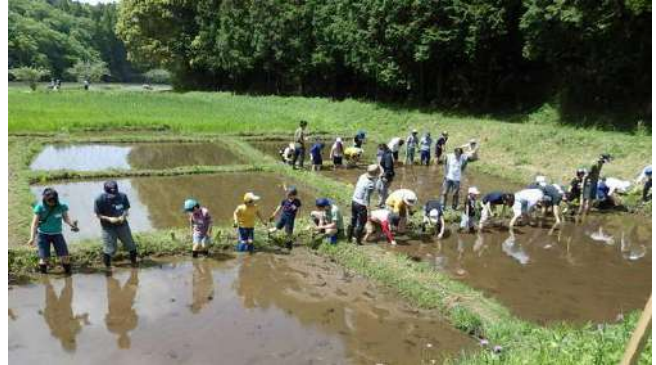
昭和の森親子田んぼ教室